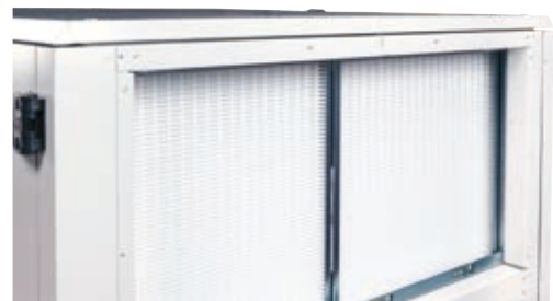
ZULUFT- UND ABLUFTFILTER

Die Gehäusebleche des Floway-Gerätes verfügen über eine dicke Dämmschicht, die für ein Höchstmaß an akustischem Komfort sorgt.